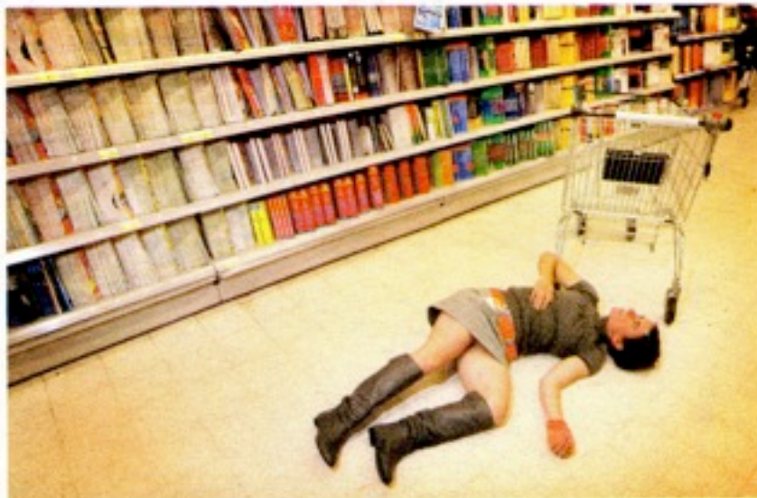
Keski.e.space test uit wat je allemaal met een winkelkarretje kan doen.