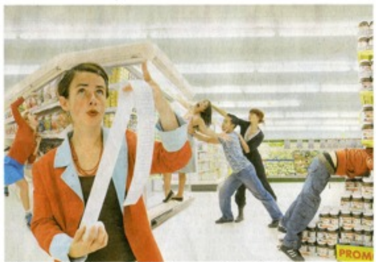
Het dansgezelschap zal tussen de rekken in de supermarkt zijn spektakel opvoeren.

Een boodschap verspreiden is niet de hoofdbedoeling. «Maar het zou mooi meegenomen zijn als de mensen achteraf gaan na-